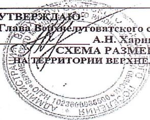
СХЕМА РАЗМЕЩЕНИЯ МЕСТ (ПЛОЩАДОК) НАКОПЛЕНИЯ ТВЕРДЫХ КОММУНАЛЬНЫХ ОТХОДОВ НА ТЕРРИТОРИИ ВЕРХНЕЛУГОВАТСКОГО СЕЛЬСКОГО ПОСЕЛЕНИЯ ВЕРХНЕХАВСКОГО МУНИЦИПАЛЬНОГО РАЙОНА (с. ВЕРХНЯЯ ЛУГОВАТКА)